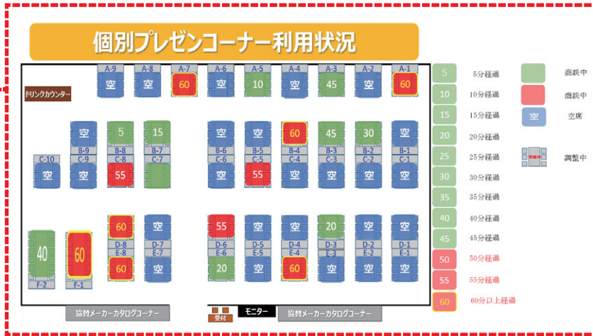
受付モニター / 商談席のリアルタイム利用状況