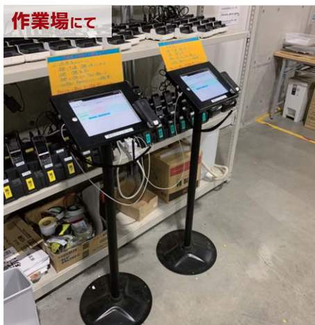
作業場に設置。CR-LASTIP13は立った状態で操作しやすい。