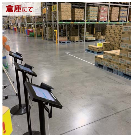
通路脇に配置しても作業の邪魔にならない。