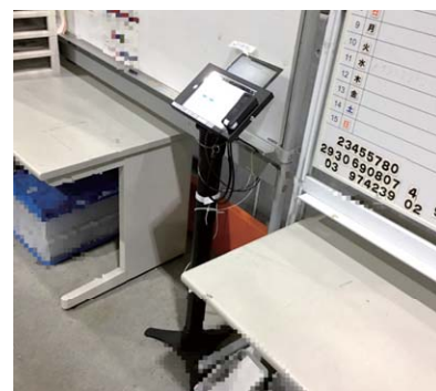
スリムな形状なので狭い隙間にも配置できる。