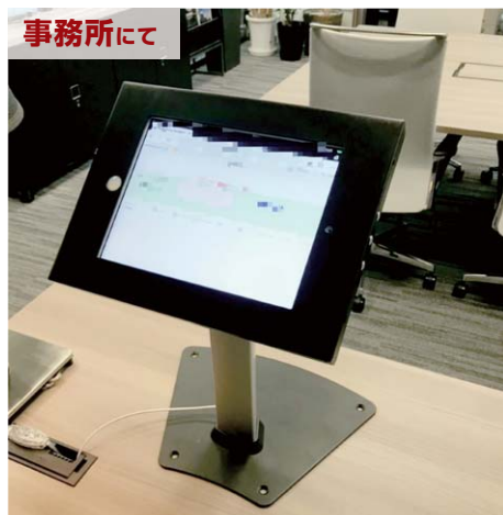
事務所に設置。セキュリティの面でも安心な鍵付きでiPadを守る。

勤怠管理システムをiPadで運用するため、セキュリティスタンドを導入。(合計245台導入)